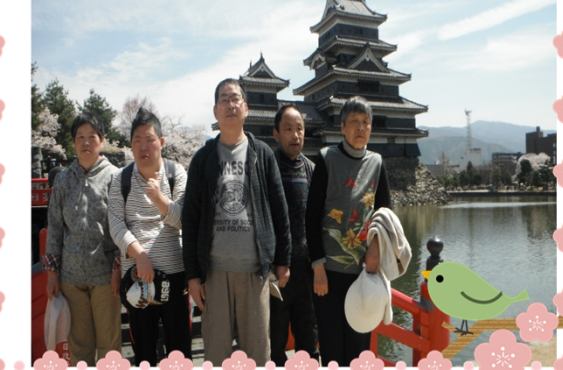
～松本城へお花見に～