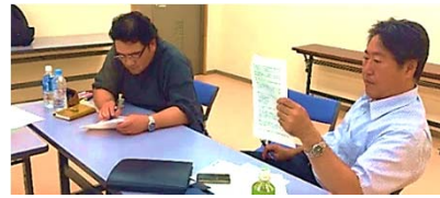
社会福祉士受験対策

平成28年3月31日に社会福祉士法及び介護福祉士法の一部を改正する法律が成立し、実務経験3年以上の方に実務者研修の受講が必要となりました。そこで平成28年7月11日に、平成29年1月に行われる国家試験合格を目指し、頑張る皆さんを対象とした対策講座を開催しました。講師には介護福祉士、社会福祉士、精神保健衛生士の3名をお迎えして、受験資格を得るために必要な研修・教育、受験申込み手続き方法、合格までの道のり(学習方法)等、分かりやすく丁寧に説明いただきました。受講生の皆さんは、資格取得という目標に向け一丸となって、とても熱心に取り組まれていました。