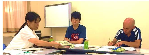
介護福祉士受験対策