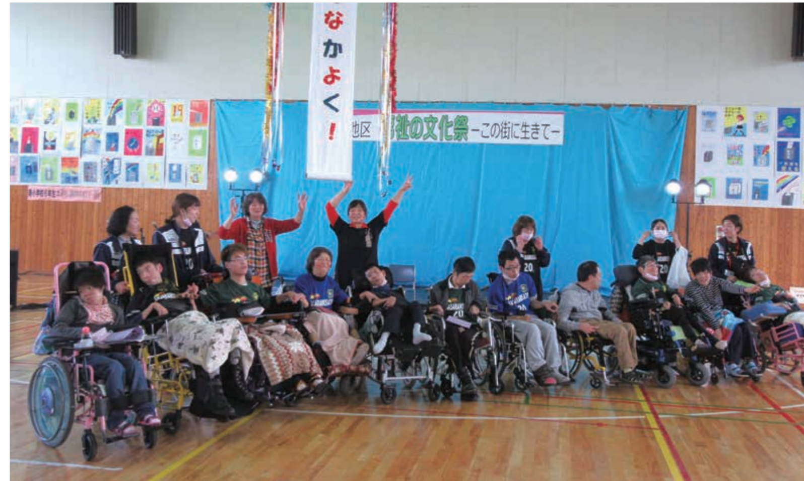
『寿地区福祉の文化祭』 2018. 11. 10 (松本市)