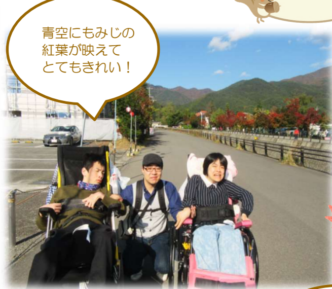
青空にもみじの 紅葉が映えて とてもきれい！