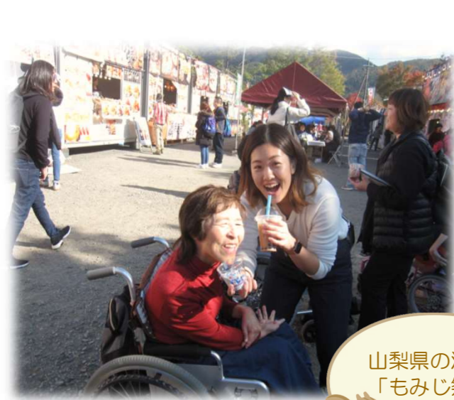
山梨県の河口湖 「もみじ祭り」