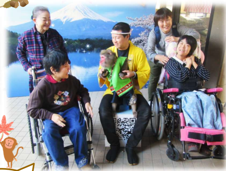
「猿まわし劇場」 お猿さんにも会えま した！