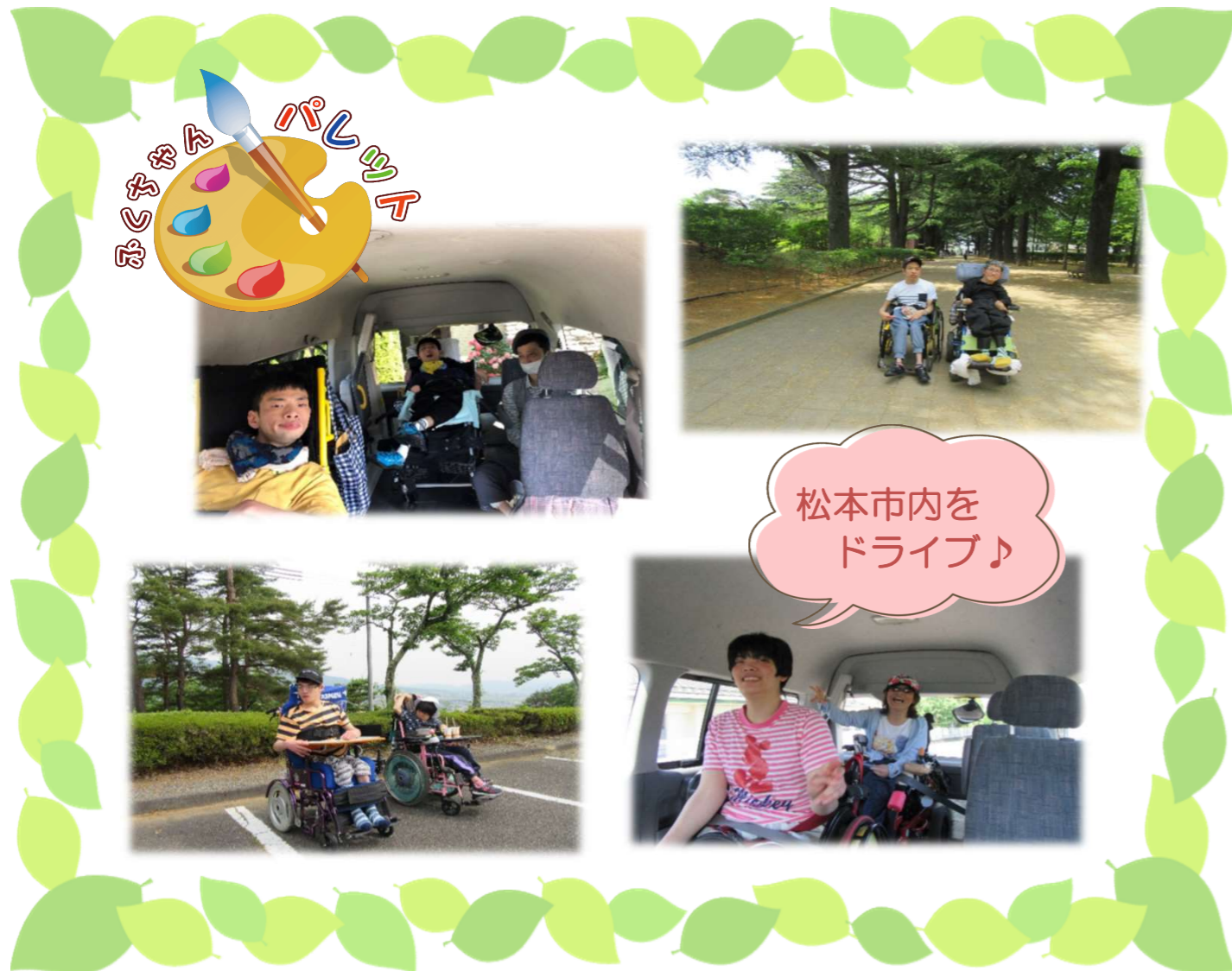
松本市内を ドライブ♪